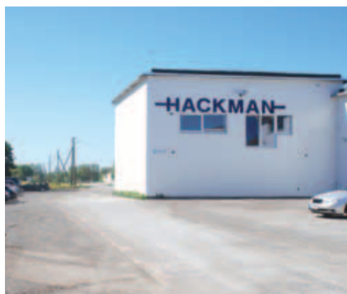
Renoveeritud Hackmani tehasekorpus Loo tööstuskeskuses.