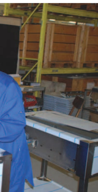
...Ja töö talle meeldib. Kolleegid ja pal k